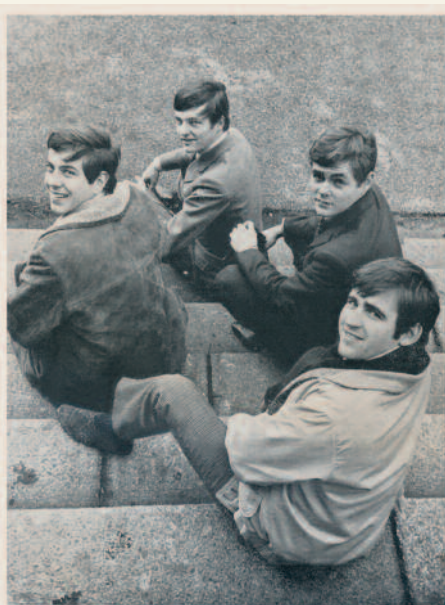
The Tonic - - - Hamburg